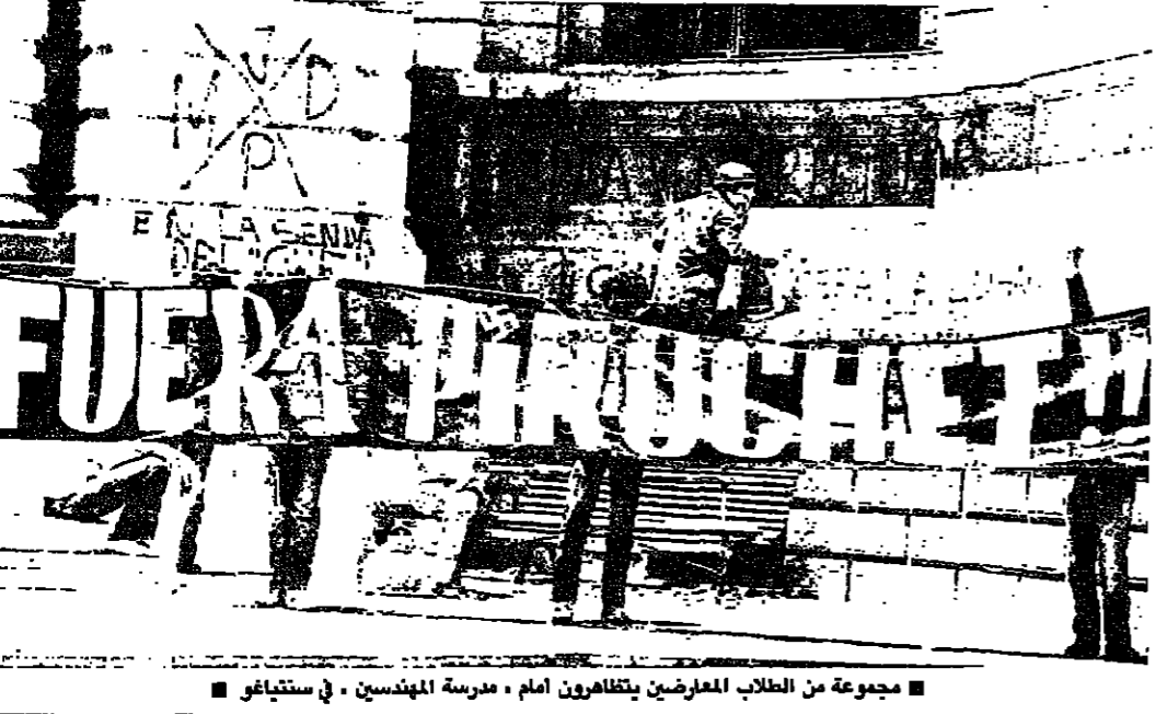
مجموعة من الطلاب المعارضين يتظاهرون امام مدرسة المهندسين في سنتياغو